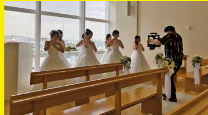
▲和歌山マリーナシティホテル内にあるチャペル。海に面した側が、全面ガラス張りとなっており、ヨットハーバーの景色がきれいに見えます。