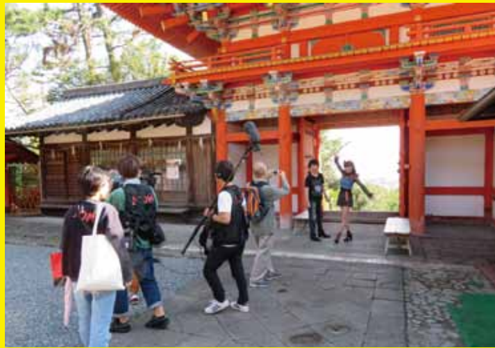
▲紀州東照宮。紀州徳川家初代藩主徳川頼宣(よりのぶ)が約400年前に父・家康の霊を祀るために造営した神社。番組では、国の重要文化財に指定されている社殿の彫刻などの魅力が紹介されました。