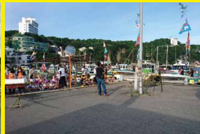
▲ゴール地点の雑賀崎漁港では、大勢の見物客がそうめんの到着を見守りました。