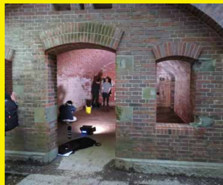
▲友ヶ島内での撮影の様子。ミュージックビデオでは、観光客に人気の第三砲台跡や、風光明媚な南垂水キャンプ場、野奈浦棧橋など、さまざまなシーンが登場します。