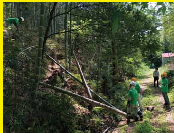
▲竹の切り出しは、和歌山市内有数のタケノコの名産地である山東で切り出されました。