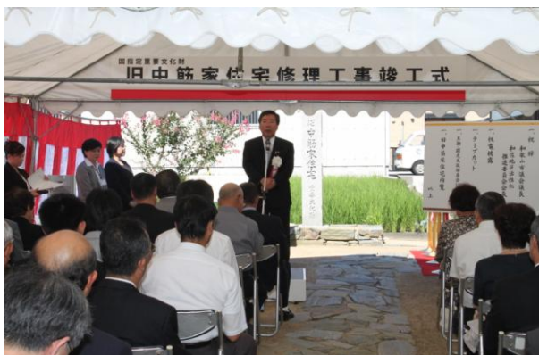
旧中筋家住宅修理工事竣工式