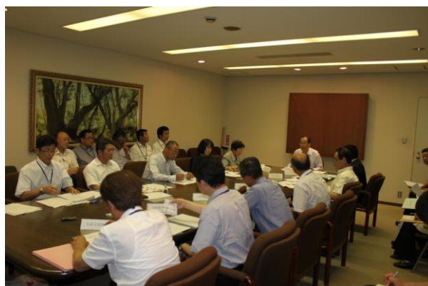
移動教育委員会（市立博物館で開催）