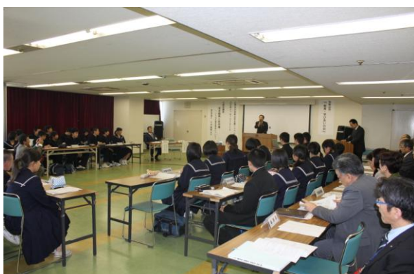
「和歌山市教育・学びあいの日」記念事業