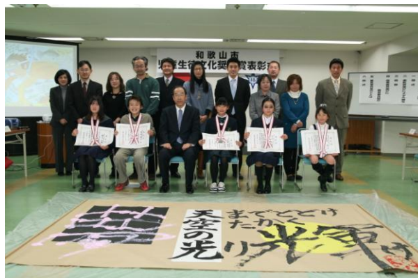
児童生徒文化奨励賞表彰式