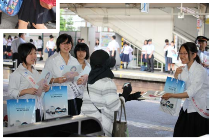
和歌山市立和歌山高等学校の生徒のみなさん