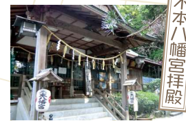
鬱蒼とした照葉樹林の小山の杜にあり、桃山時代の遺風が残されている貴重な建造物であるといわれ、本殿は県指定文化財建造物に指定されています。