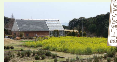
ラベンダーやミントなど四季折々の豊かなハーブに彩られた香りや、豊かな自然と人とのふれあいを満喫できる憩いのスポットです。