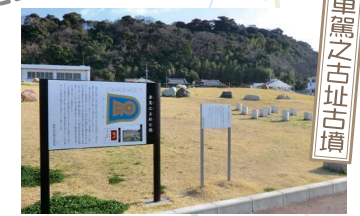
5世紀後半に築かれた和歌山県下最大規模の前方後円墳で、日本で唯一といわれる金製の勾玉が発見されるなど全国的に注目を集めています。