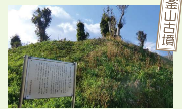
釜山古墳群は釜山古墳、車駕之古址古墳、茶臼山古墳の3基が東西に並び、和歌山県の史跡に指定されています。