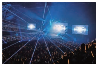
TGC 和歌山 2023