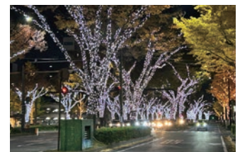
けやきライトパレード