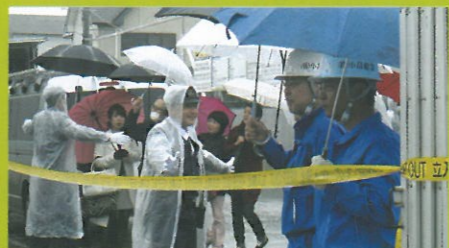
▲雨の中、エキストラも警察と野次馬に分かれて奮闘。