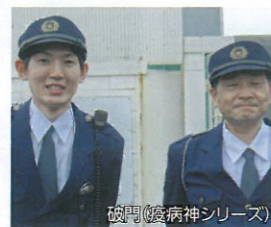
▲本番前の2人 (ちょっと緊張気味?!)