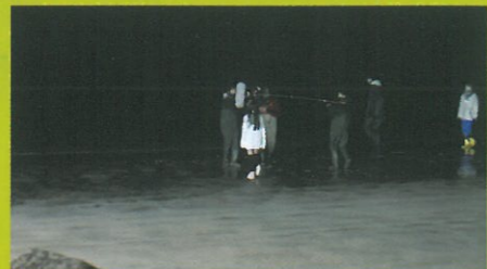
▲少女が海に入っていく回想シーンの撮影