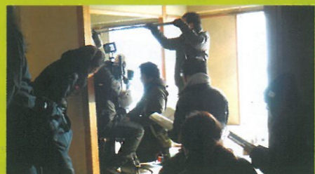
▲廃墟ビルでの撮影風景