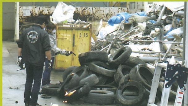
▲火災発生シーンの準備をするスタッフ

舞台設定は大阪だが、撮影場所は和歌山市。極寒の中、市内数箇所まで撮影が行われた。産業廃棄物業者の現場から火災が発生したシーンでは、市民エキストラも参加。