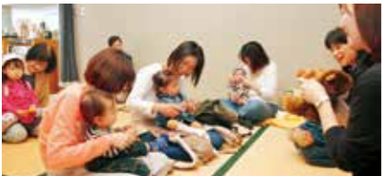
↑0～2歳の赤ちゃんのためのおはなし会