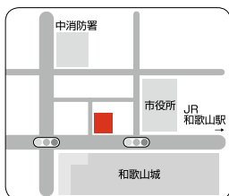
市選挙管理委員会事務局