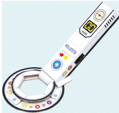
金属探知機組立キット(化粧箱)