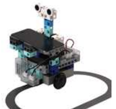
ブロックロボティスト センサカー