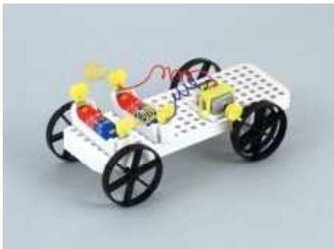
ソーラーカーエボリューション