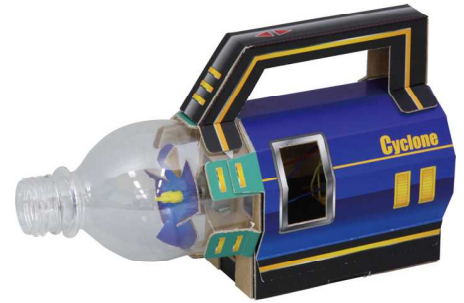
☆サイクロンクリーナー(化粧箱)