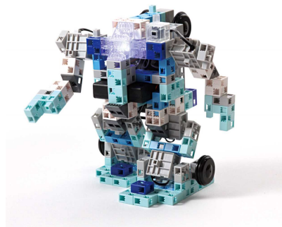
Artec ブロックロボティストベーシック