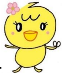
子育てひろば マスコットキャラクター こびちゃん