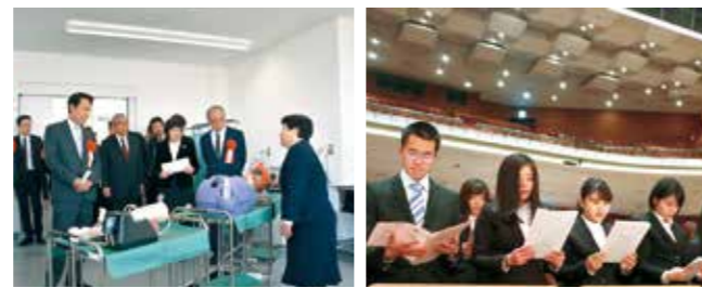
(上) 旧雄湊小学校の跡地を整備してつくられた新キャンパス。 (左) 希望を胸に104人の学生が入学しました。ここから、和歌山市に愛着を持った看護師が育つことを期待します。