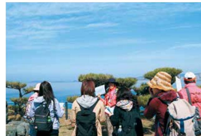
番所庭園からウォーキング開始。語り部の解説を聞きながら和歌の浦を散策。

19歳以下の選手が組み立て、プログラミングした自律ロボットの国際的競技会が和歌山市で初めて開催されました。日本各地から選手が集まり、サッカー、レスキュー、オンステージと特色の異なる3つの競技で競い合い、熾烈な戦いが繰り広げられました。今回から3年連続で和歌山市での開催を予定しています。