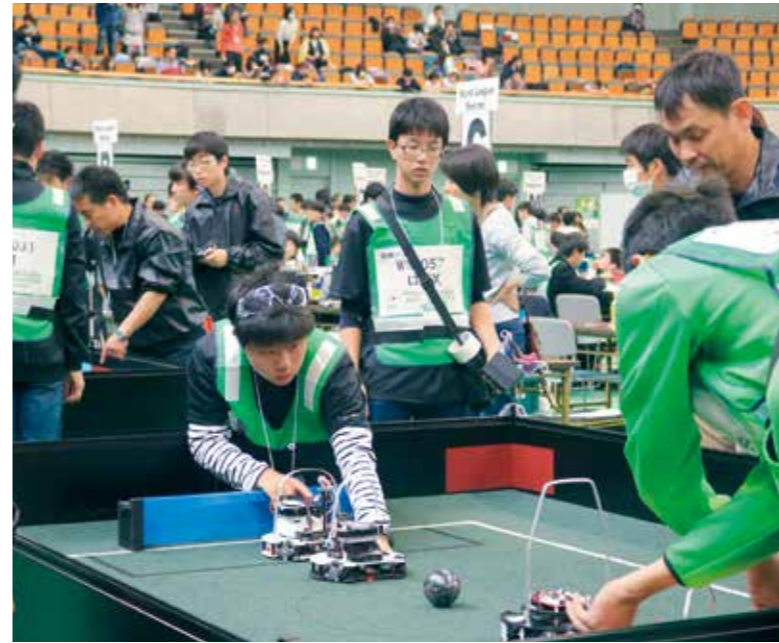
サッカー競技は、人のサッカーと同様に前半・後半の合計点で勝敗を競う。