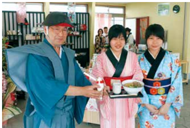
町娘など時代衣装をまとったスタッフがおもてなし。

「まちなか3大学誘致」の1校目として、東京医療保健大学和歌山看護学部の雄湊キャンパスが完成しました。同キャンパスは旧雄湊小学校の跡地に整備され、1・2年生が看護職の基礎を学びます。4月8日、県民文化会館で入学式が行われ、これから104人の「看護師の卵」が和歌山市のまちなかで看護を学びます。