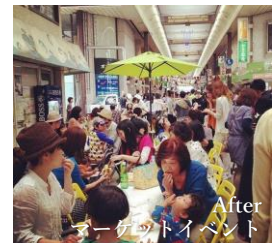
After マーケットイベント