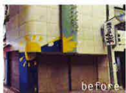
石窯ポポロ (和歌山市) …農園レストラン