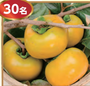
柿(3kg)、 和歌山市物産 (ジンジャーエール、生姜佃煮)