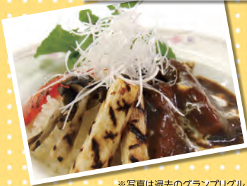
※写真は過去のグランプリグルメです。