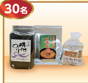
和歌山市物産 詰め合わせ (味付のり、茶粥、温泉のもと)