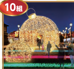
光のフェスティバル フェスタ・ルーチェ ペアチケット