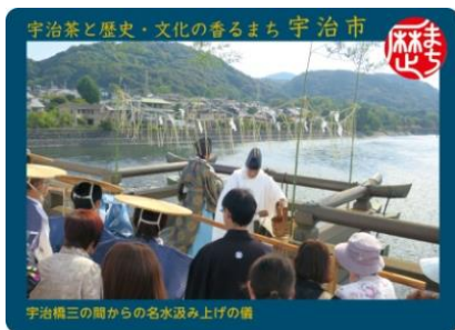
宇治橋三の間からの名水汲み上げの儀