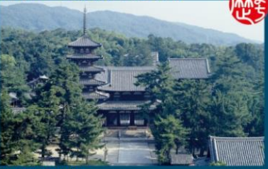
世界文化遺産 法隆寺