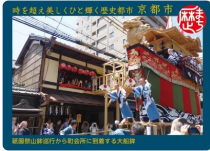
祇園祭山鉾巡行から町会所に到着する大船鉾