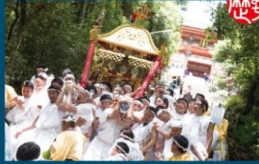
江戸時代から続く紀州東照宮例大祭「和歌祭」