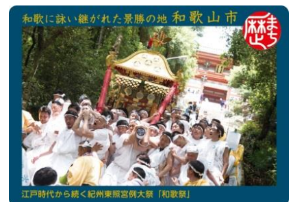
歴まちカード(和歌山市)表面