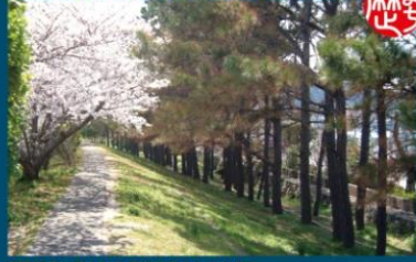
江戸時代に築かれた津波防壁のための堤防