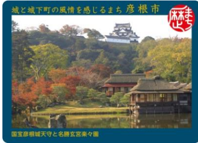
国宝彦根城天守と名勝玄宮楽々園