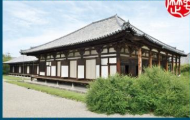
国宝元興寺極楽堂（本堂）