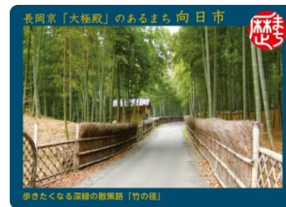
歩きたくなる深緑の散策路「竹の径」