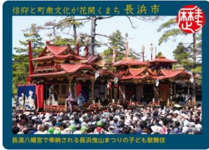
長浜八幡宮で奉納される長浜曳山まつりの子ども歌舞伎