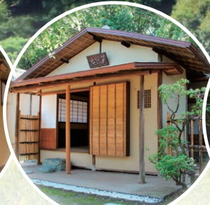
芦鶴庵(ろかくあん)