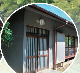
岡陽軒(こうようけん)