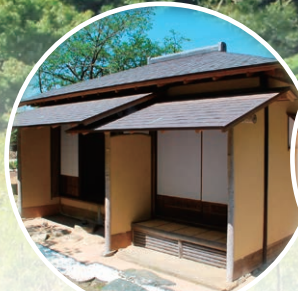
夜雨荘(やうそう) ※見学のみのみ