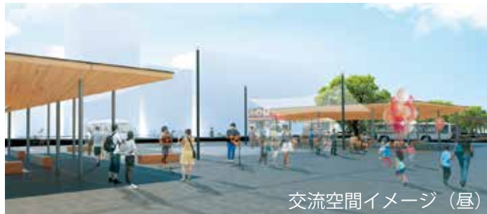
交流空間イメージ (昼)

新しい駅前広場には、屋根の軒裏に紀州材を活用したシェルターがあり、電源・水道などを備え付け多種多様なアクティビティができます。「紀州の玄関口」として相応しい、皆さまから親しまれる交流空間を整備します。