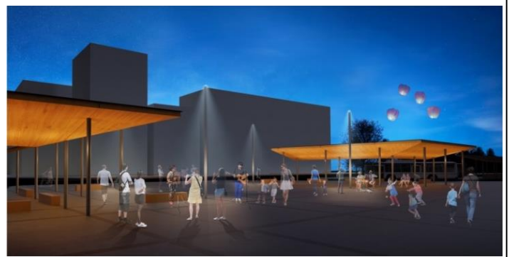
交流空間イメージ（夜）