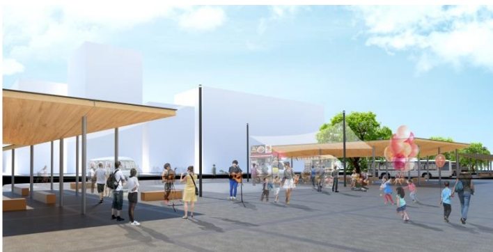
交流空間イメージ（昼）