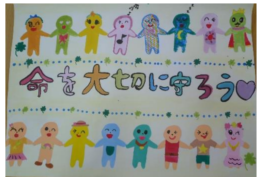
山下 莉花 様