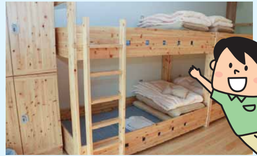
▲紀州材を使用したベッド

センター内の宿泊室のベッドには、和歌山県原産の木材「紀州材」が使用されています。紀州材の優しい香りと、木材独特のぬくもりに包まれてリラックスできるよ!