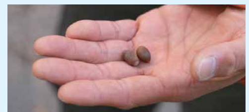
▲森に落ちていた木の实

敷地内の森には、たくさんの木の実や葉っぱが落ちています。耳を澄ますと、小鳥の声や木の実が落ちる音、葉が揺れる音が聞こえてきます。広大な自然を体全体で感じ、自然と一体になる感覚を味わってみよう!