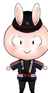
和歌山市消防局 マスコットキャラクター わ 「和びつとちゃん」