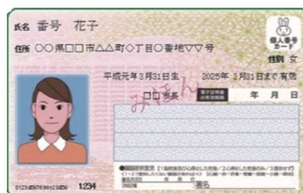
マイナンバーカード（個人番号カード） （顔写真付きのICカード）