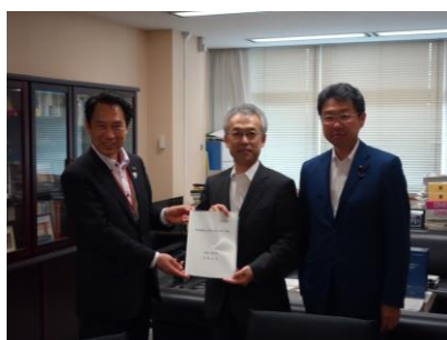
国土交通省 菊池港湾局長