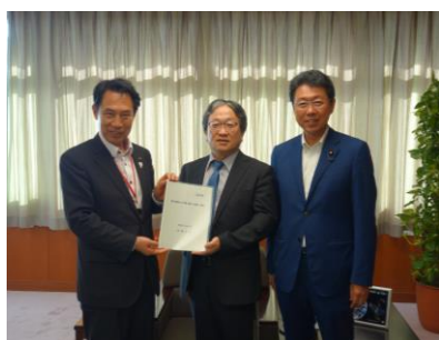
国土交通省 森技監