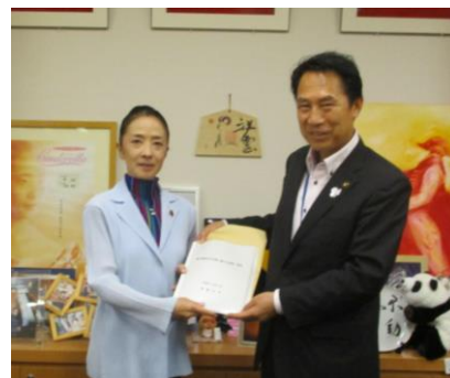
浮島とも子 衆議院議員