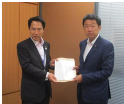
門博文 衆議院議員