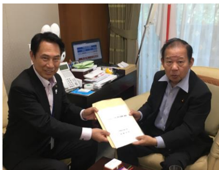
二階俊博 自由民主党幹事長