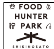
「味覚ゾーン」 【ロゴマーク(案)】