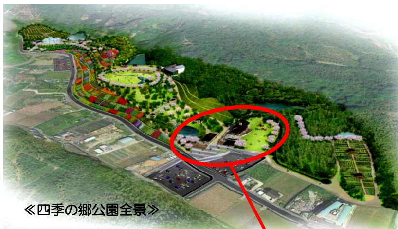
「四季の郷公園全景」