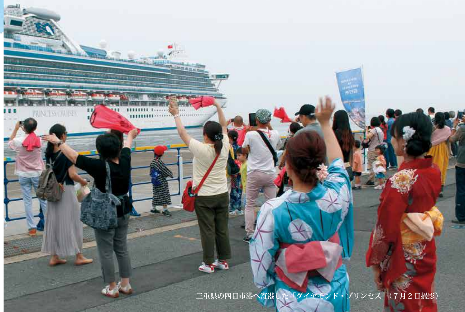
三重県の四日市港へ寄港した「ダイヤモンド・プリンセス」(7月2日撮影)