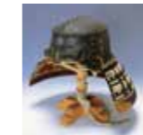
かなさびしさいかいばちかぶと 鉄錆地雑賀鉢兜