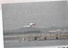
ヘリによる被害調査