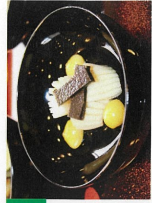
④ 煮物 花烏賊