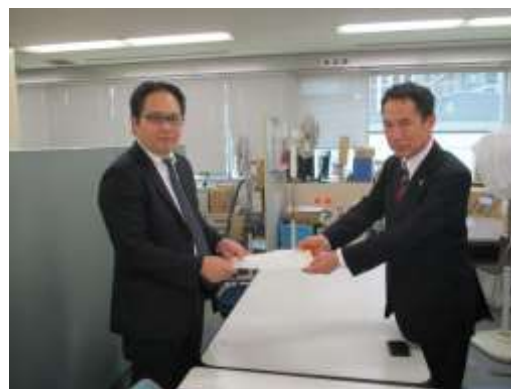
中小企業庁へ要望