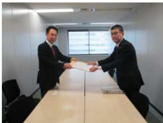
経済産業省製造産業局へ要望