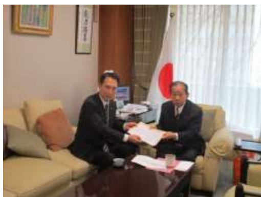
二階自由民主党幹事長へ要望