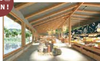
農産物直売所 (イメージ)