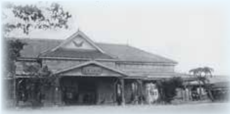
初代駅舎 明治36年(1903年)～昭和20年(1945年)