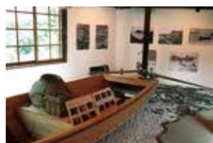
昔の雑賀崎を感じられる資料館