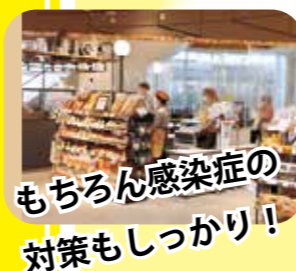
もちろん感染症の対策もしっかり!