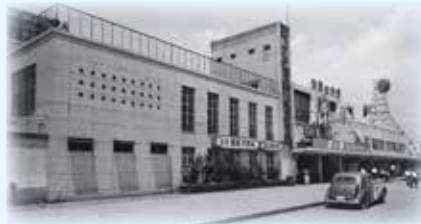
二代目駅舎 昭和30年(1955年)～昭和48年(1973年)