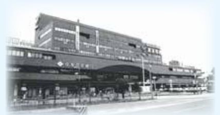
三代目駅舎 昭和48年(1973年)～平成29年(2017年)