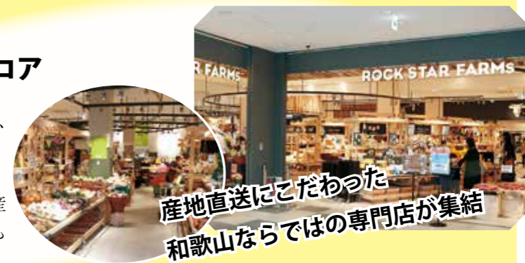
産地直送にこだわった和歌山ならではの専門店が集結

野菜・肉・魚などの生鮮食品や、惣菜・弁当、さらに植物の専門店なども集まるスーパーマーケットやドラッグストアなどの便利な店舗が揃っています。対面型で生産者とのコミュニケーションも深まります。