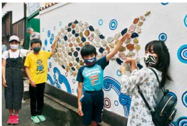
雑賀崎小学校・幼稚園の児童・園児により寄贈された作品