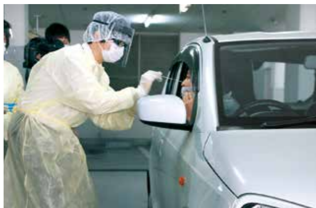
ドライブスルー方式のPCR検査(再現)

新型コロナウイルス感染症疑いの方へ迅速な検査を行うことで、医師や患者の負担を少なくすることを目的として、市保健所の地下に「和歌山市 PCR 検査センター」を設置しました。ドライブスルー方式での検査が可能で、多くの対象患者に検査をすることができるようになります。市内での感染拡大防止に繋がっていきます。(検査には医療機関を通じての予約が必要です)