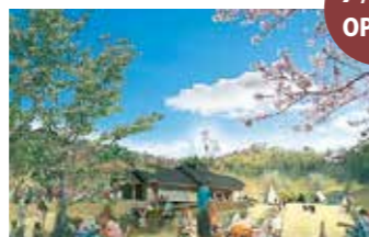
地域食材レストラン (イメージ)