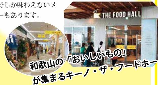
和歌山の「おいしいもの」が集まるキーノ・ザ・フードホール

肉料理・魚料理・和食・イタリアンなど様々な「食」を集めたレストラン街「キーノ・ザ・フードホール」には、和歌山ローカルの人気店が集結。ここでしか味わえないメニューもあります。