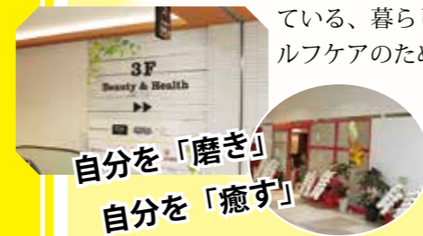
自分を「磨き」自分を「癒す」

様々な医療機関のクリニックモールと、ヨガスタジオ、スポーツクラブ、サロンなどが集まっている、暮らしに寄り添ったセルフケアのためのフロアです。