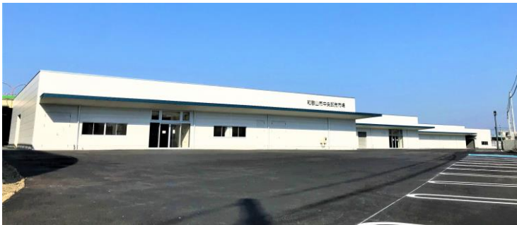
総合食品センター（全体）