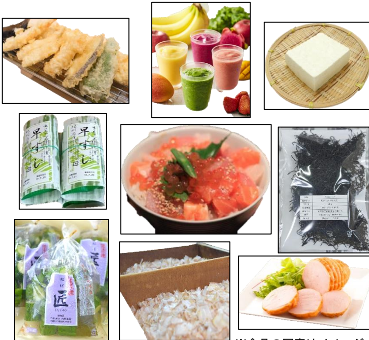
※食品の写真はイメージ