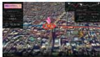
動画完走証イメージ

また、期間内に完走された方には、完走賞として、動画完走証(実際の『和歌山ジャズマラソン』のコースや名所を確認可能)の視聴及びオリジナルランナーマスクの送付、さらに抽選で令和3年度開催予定の『和歌山ジャズマラソン』の出走権(10名)または和歌山の名物(100名)をプレゼント♪