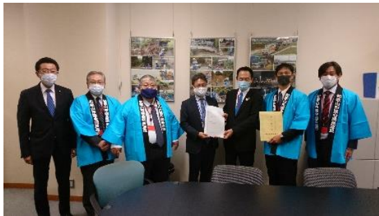
国土交通省 水管理・国土保全局長