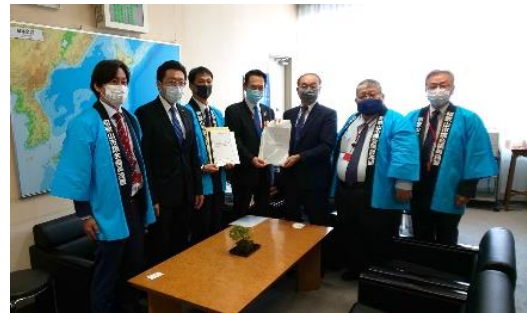
国土交通省 道路局長