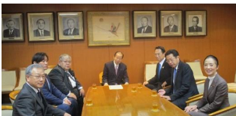
二階俊博 自由民主党幹事長