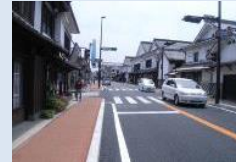
無電柱化・美装化イメージ