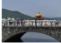
和歌祭（渡御行列の巡行）

紀州東照宮の和歌祭は、和歌の浦の景勝をあらゆる要素が随所に盛り込まれ、町並みや和歌浦湾を背景に和歌浦一帯を練り歩く。また、和歌浦天満神社の天神祭は、地域に密着し風物詩として人々に親しまれてきた。さらに、和歌の浦の景観や自然は人々の保全活動により守られてきた。