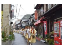
葛城修験・春の峰入り

平安時代末期から続く葛城修験は、修験の形式は一部変容しながらも、自然を信仰の対象とし、自然から力を得るといふ人々の目的は変わらず受け継がれている。