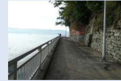
和歌浦観光遊歩道