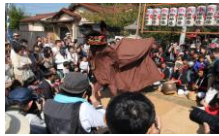
宮ノ原で行われる獅子舞

木ノ本八幡宮の例大祭は約500年継承される伝統行事であり、笛や太鼓の音に合わせた豪快な舞いは、木ノ本地区の人々にとっての誇りであり、次の世代へと受け継がれてきた。