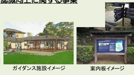
ガイダンス施設イメージ

和歌の浦の魅力を広く発信・周知するため、様々な情報ツールを活用したPRを展開する。