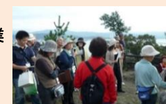
まち歩きイメージ