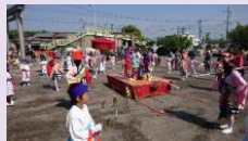
和歌祭の祭礼衣装

和歌祭本来の鮮やかさを復原するため、祭で使用される伝統的な祭礼用具や衣装等の新調・修繕を行う。