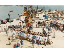
雑賀崎の神木（神木）

雑賀崎・田野浦・和歌浦は、現在も漁業が生業として続けられるとともに、漁業に結びつく伝統行事が継承され、地域に根付いた行事として大切にされている。