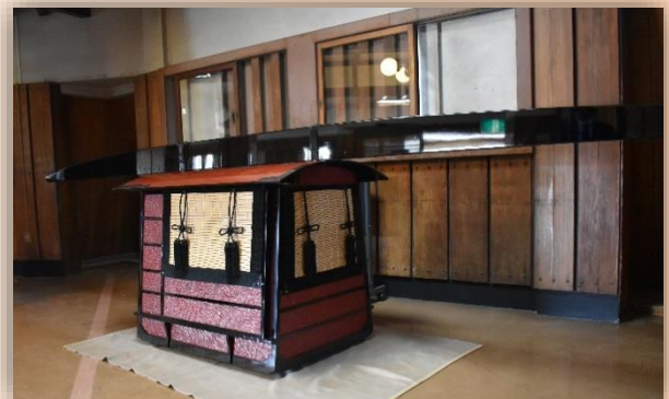
※展示の様子は写真とは異なります。