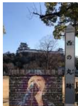
AR機能を使用した撮影写真のイメージ(和歌山城)