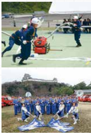
(上) ポンプ等の技術を競う消防操法大会 (下) 消防音楽隊も機能別の消防団員です

消防団の役割 消防署とともに、地域の安全・安心に無くてはならないのが消防団です。消防団員は「自分たちのまちは自分たちで守る」という信念のもと、普段は自分の仕事を持ちながら、災害時には現場に駆け付け、消火活動・救助活動・水防活動などに従事する、まさに地域のヒーローのような存在です。 平時は、訓練や施設・設備の維持管理、防火広報・啓発活動、そのほか地域に密着した活動を行い、地域の防災力向上や地域コミュニティの活性化に大きく貢献しています。