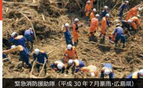
緊急消防援助隊 (平成 30 年 7 月豪雨・広島県)