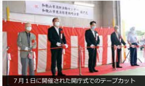
7月1日に開催された開庁式でのテープカット