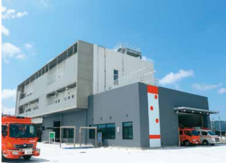
和歌山市消防活動センター・和歌山市東消防署岡崎分署

この街と人を守るために、消防では様々な人たちが連携しています。特に大規模災害の際は、全国からの緊急消防援助隊や地域の消防団とタッグを組んで活動を行います。 7月1日には、全国からの緊急消防援助隊の活動拠点として、和歌山南スマートインターチェンジに直結した立地に「和歌山市消防活動センター」が開庁しました。今回は、新たに開庁したセンターと、日頃から地域を守る消防団について紹介します。