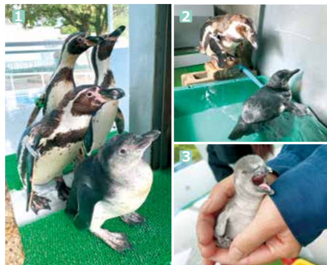
1 手前が「ワコ」。その左が父の「ハツ」、奥の左から順に母「ココ」と姉「ハコ」 2 父に見守られながら水に慣れる練習をするワコ 3 ふ化直後の様子