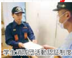
学生消防団活動認証制度

また、団での訓練や講習を通して自らの防災力も向上させることができます。消防団は、地域の安心・安全を守る要としてとても大切な存在です。