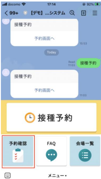
①「予約確認」ボタンをタップする