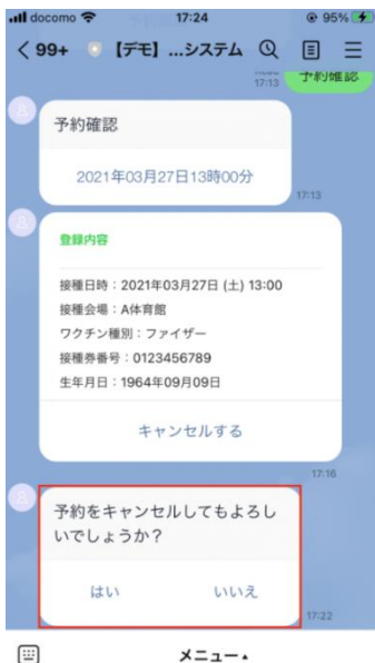
④「予約をキャンセルしてもよろしいでしょうか？」の質問が出す