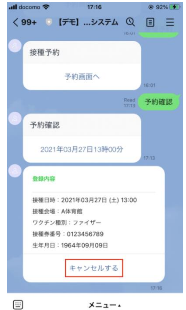
③「キャンセルする」テキストリンクをタップする