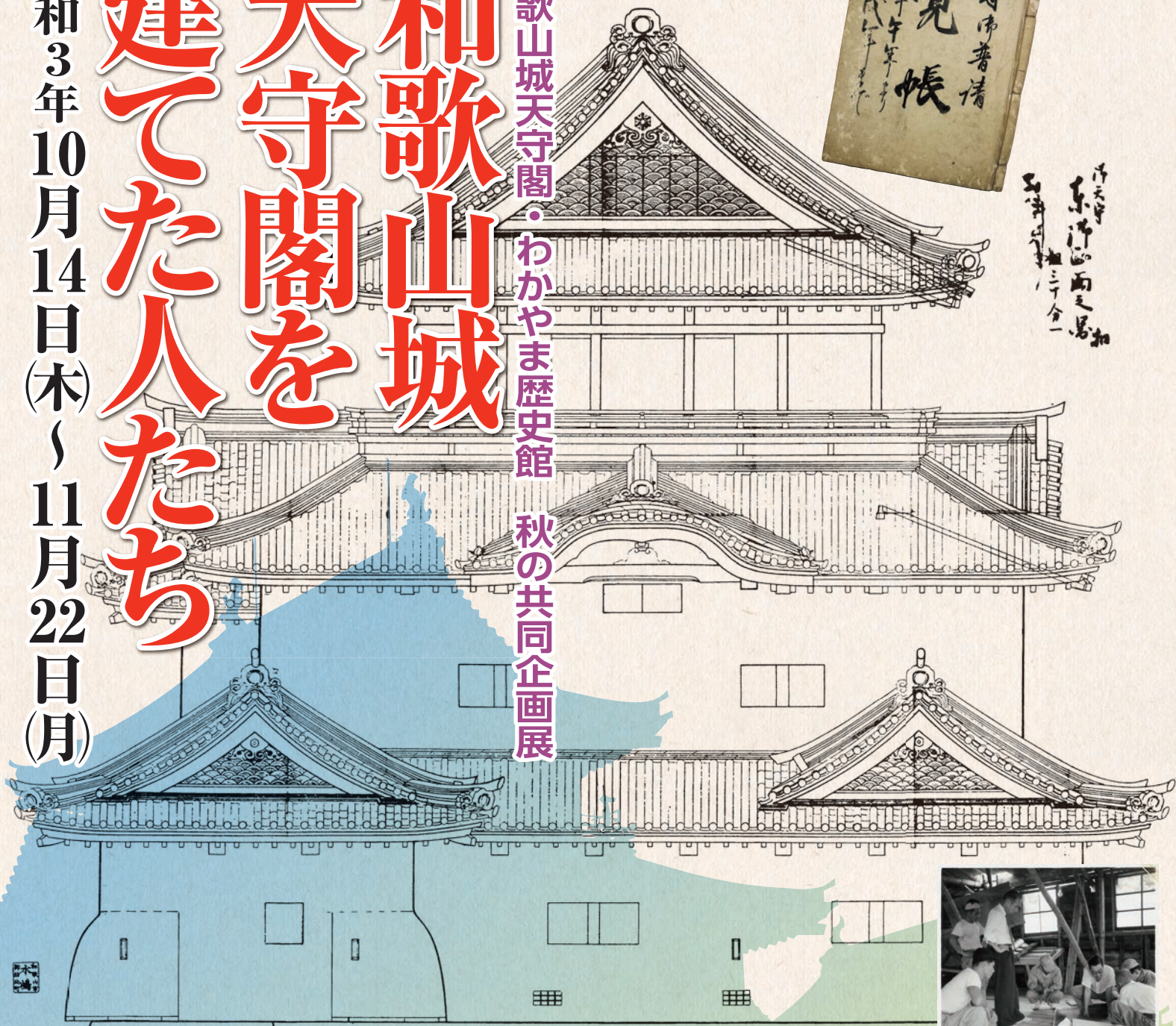
背景：古写真「御天守東御正面之図印」、右下：古写真「設計図をみる人たち」、右上：「御天守御普請覚帳」