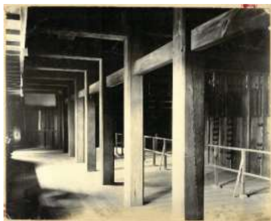
古写真 和歌山城大天守一階【和歌山城整備企画課蔵】 昭和の空襲で焼失する前の和歌山城の大天守の一階内部。

和歌山城天守閣の建築工事に携わった人たちの史料を通じて、その仕事ぶりや工事の経緯、再建された天守閣についてご紹介します。