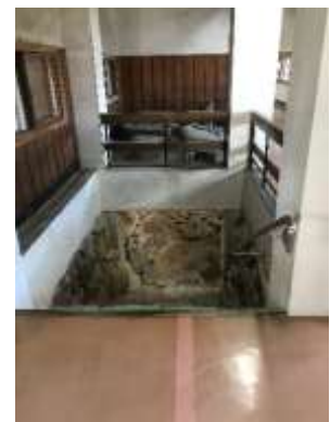
おだいどころ 御台所からみた埋門

普段は非公開の埋門（石垣に埋め込まれるように設けられた門）を、期間限定で公開します。公開日に和歌山城天守閣へご入場いただいた方は、ご覧いただくことができます。別途入場料もかかりません。