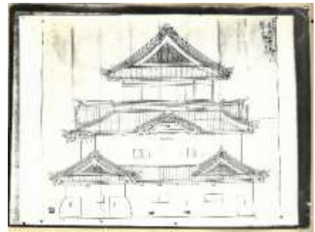
古写真 御天守東御正面之図扣 【和歌山城整備企画課蔵】