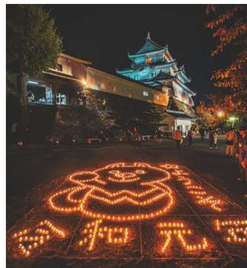
竹燈夜インスタコンテスト2019「入賞作品」