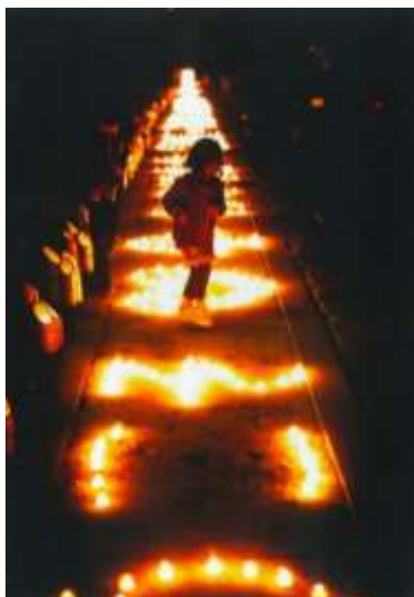
竹燈夜フォトコンテスト2019「最優秀作品」