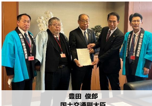
豊田 俊郎 国土交通副大臣