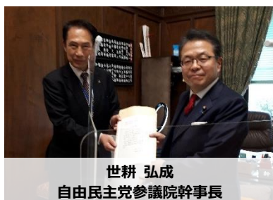
世耕 弘成 自由民主党参議院幹事長