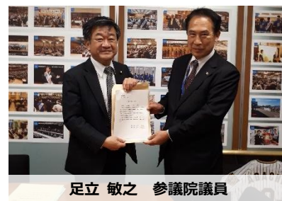
足立 敏之 参議院議員