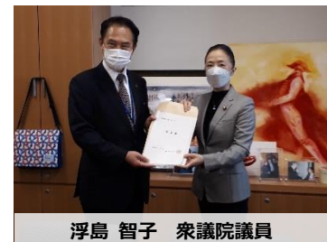
浮島 智子 衆議院議員