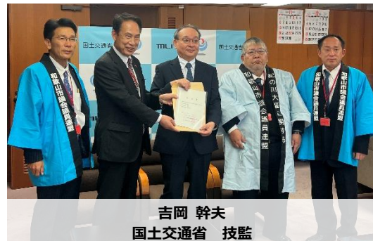
吉岡 幹夫 国土交通省 技監