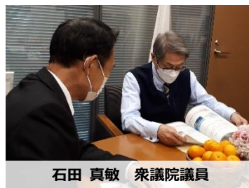
石田 真敏 衆議院議員