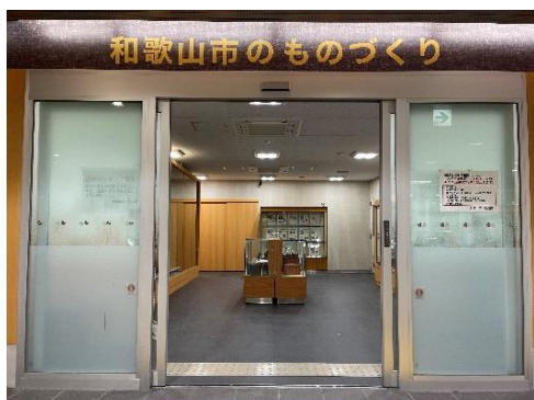
和歌山市のものづくり

ニット、皮革、木工（和家具・洋家具等）、機械金属や化学に関する製品やパネルの展示