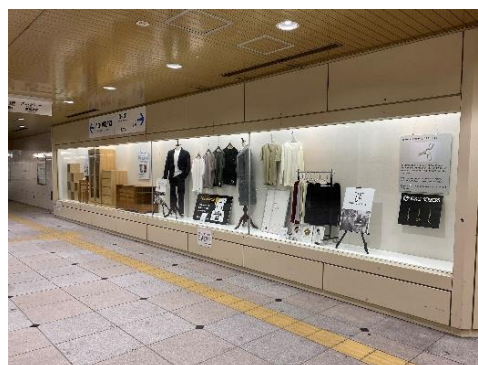
わかちか広場展示ケース