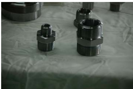
桜井鉄工で製作している「継手」