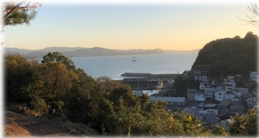
雑賀崎の街並みや漁港などが一望できる眺望

旧雑賀崎小学校跡地を公園として整備することで、「日本遺産・和歌の浦」を構成する雑賀崎の風情ある街並みや漁港などが一望できる良好な景観が望める公園となり、眺望を楽しめることはもちろん、津波発生時の一時避難場所としても活用できるよう整備したものです。公園内にはブランコやベルモニュメントなどを配置し、雑賀崎の観光や回遊の拠点として地域の活性化につながることを期待しています。