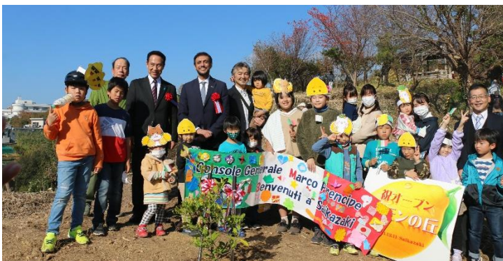
【R3.12.11 レモンの木を植樹したときの様子】