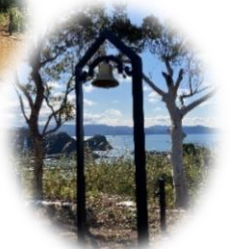
ベルモニュメント