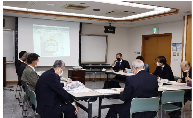
第2回市堀川かわまちづくり協議会 開催風景