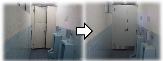
[パーティションの改修]