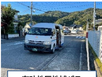
有功地区地域バス