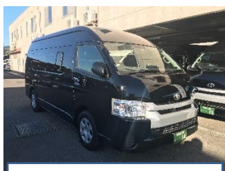
木本・西脇地区地域バス