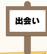
最近、 出会いが少ないなあ