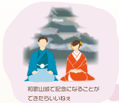
和歌山城で記念になることができたらいいねえ