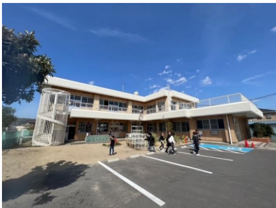
シカゴテラスの外観