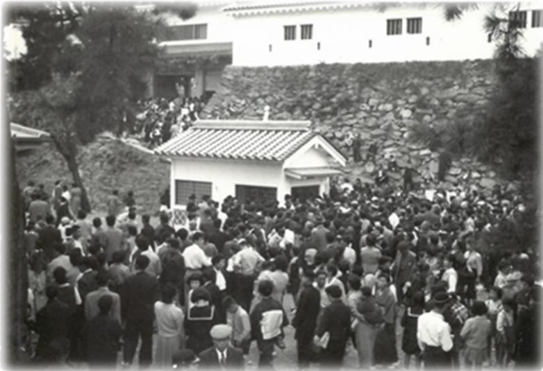
再建された和歌山城天守閣を訪れる人々 【昭和33年(1958年)の古写真】 (和歌山城整備企画課蔵)

令和5年(2023年)は、和歌山城の内郭が初めて一般公開されてからちょうど150年目の記念の年にあたります。