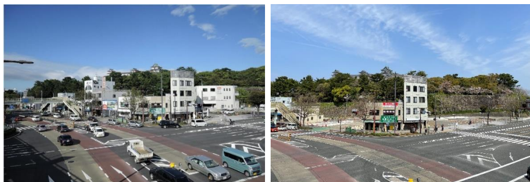
和歌山城 扇の芝(城の手前の建物群付近 平成30年の写真(左)、令和5年の写真(右))