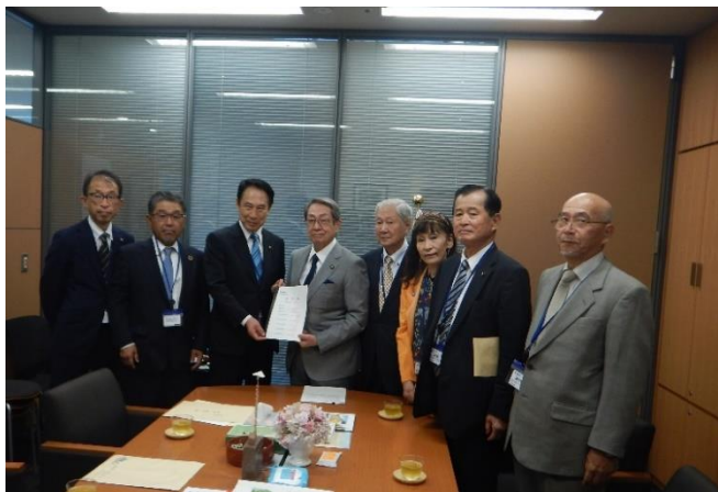
石田 真敏 衆議院議員