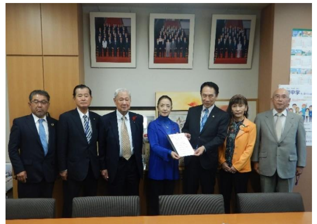
浮島 智子 衆議院議員