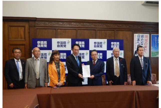
世耕 弘成 参議院自由民主党幹事長